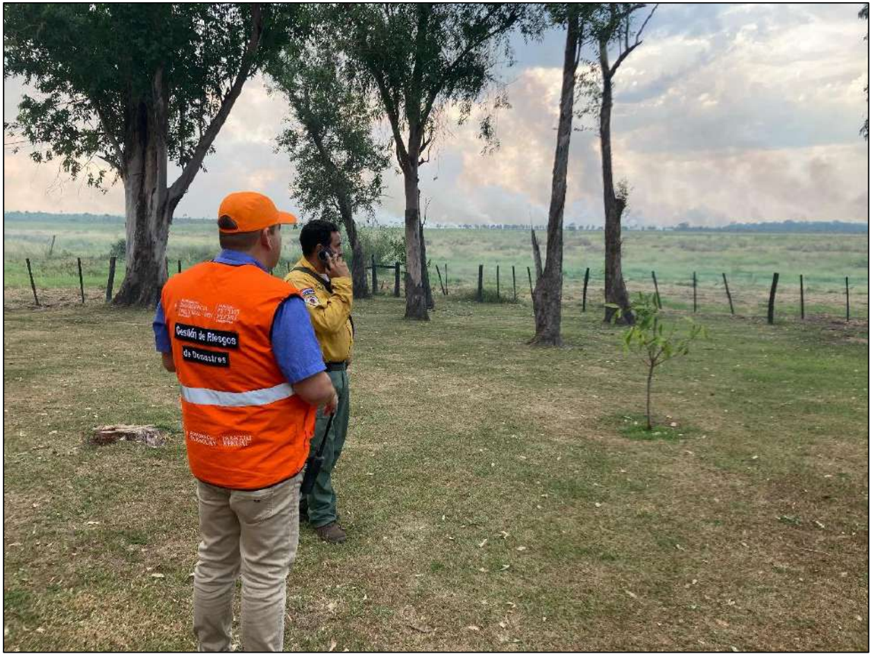
Llegada al Incidente, estableciendo Puesto de Comando, prioridades y movilizando recursos.